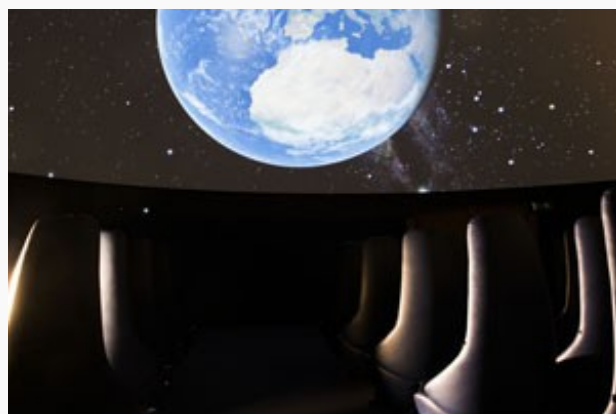
No Campo Alegre, os participantes poderão assistir às sessões disponibilizadas no domo do Planetário.